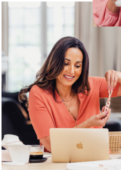
Je eigen online shop.